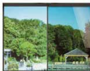
3M™ Prestige 40 Exterior