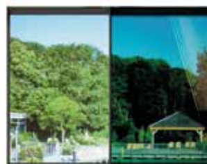
3M™ Prestige 20 Exterior