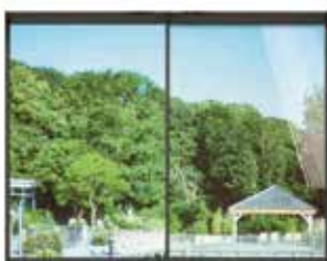
3M™ Prestige 90 Exterior

Wij bieden de Prestige exterior folies aan in 4 varianten. Namelijk de 3M™ Prestige 90, 3M™ Prestige 70, 3M™ Prestige 40 en de 3M™ Prestige 20 variant. De folies hebben allemaal dezelfde prijs maar andere zonwerende eigenschappen.