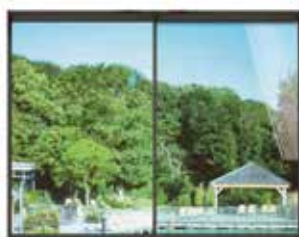
3M™ Prestige 70 Exterior